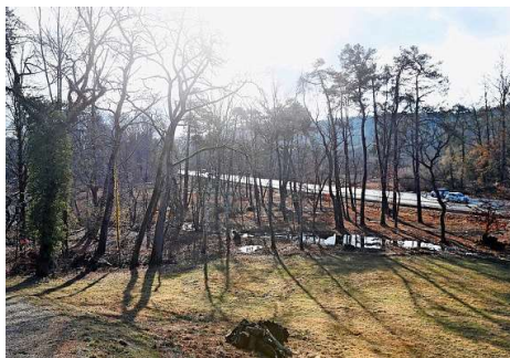
Der Moorboden beim Gut Katzensee ist durch eine Aufschüttung zugedeckt.

Es geht um eine 2200 Quadratmeter grosse Wiese angrenzend an den Moorwald beim Unteren Katzensee. Die leicht geneigte Fläche wurde vor etwa hundert Jahren aufgeschüttet und so das ursprüngliche Torfmoor und der Hang mit Bodenmaterial überschüttet. Der Pächter des Guts Katzensee hat die Fläche bis 2021 als extensive Weide genutzt. Jetzt möchte die Fachstelle Naturschutz den Oberboden abtragen, denn die aufgeschüttete Fläche liegt zu hoch über dem Grundwasserspiegel, als dass sich eine Moorvegetation darauf entwickeln könnte. Davon profitieren sollen seltene Pflanzen wie etwa die Schnurwurzel-Segge, die Torf-Segge und das Zierliche Woll-